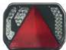
Feu LED 12 V 6 fonctions : 2 connecteurs, 8 broches, 2 connecteurs, 2 broches. Dim. : 185 x 145 x 35 mm.

Indice de protection IP 69 6 : totale protection contre la poussière 9 : protection contre le nettoyage haute pression