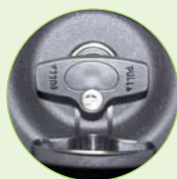
Serrure intégrée à la poignée