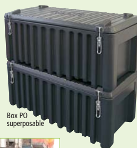
Box PO superposable