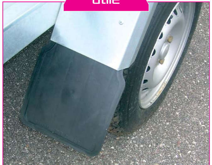
4856A Bavette noire 200 x 230 mm. Fixation 120 mm.