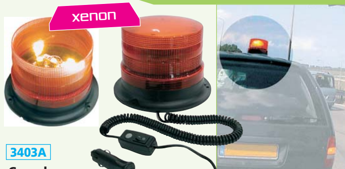
3403A Gyrophare magnétique Xénon