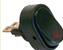
E 3330A Interrupteur à bascule LED rouge

Interrupteur à bascule ON / OFF avec voyant à LED rouge Montage en applique Perçage Ø 10 mm - 12 V - 16 Ampères Dimensions extérieures : 30 x 18 mm - Epaisseur : 15 mm