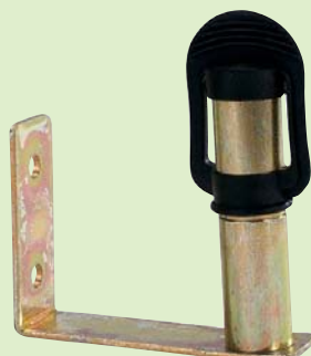
3406B B Connexion gyrophare à visser