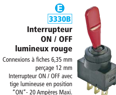
E 3330B Interrupteur ON / OFF lumineux rouge Connexions à fiches 6,35 mm perçage 12 mm Interrupteur ON / OFF avec tige lumineuse en position "ON" - 20 Ampères Maxi.

Interrupteur à bascule ON / OFF avec voyant à LED rouge Montage en applique Perçage Ø 10 mm - 12 V - 16 Ampères Dimensions extérieures : 30 x 18 mm - Epaisseur : 15 mm