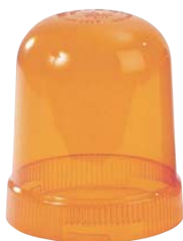
3404 Cabochon orange SIRIUS lisse de remplacement