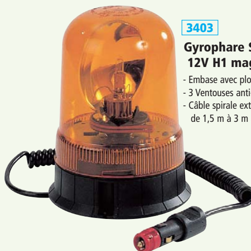
3403 Gyrophare SACEX/SIRIUS 12V H1 magnétique