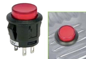
E 3330E Interrupteur 12 V 20 A. Rouge. Ø 18 x 25 mm. Perçage 16 mm.