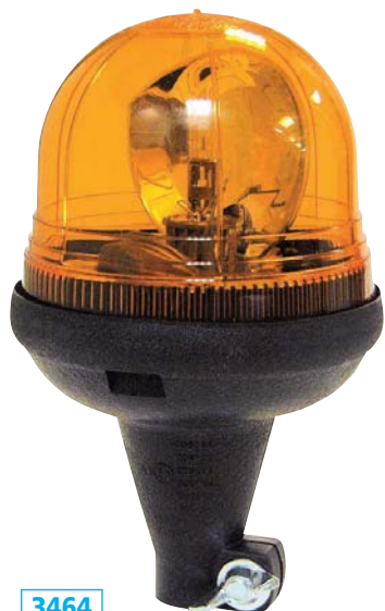
3464 Gyrophare SACEX/VEGA 12V H1 sur tige flexible